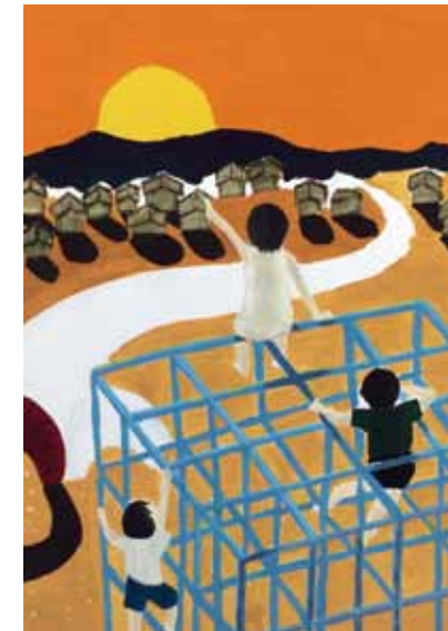
○京都精華大学 イラストレーションコース 合格 中野公晃(宇和島東 高校)