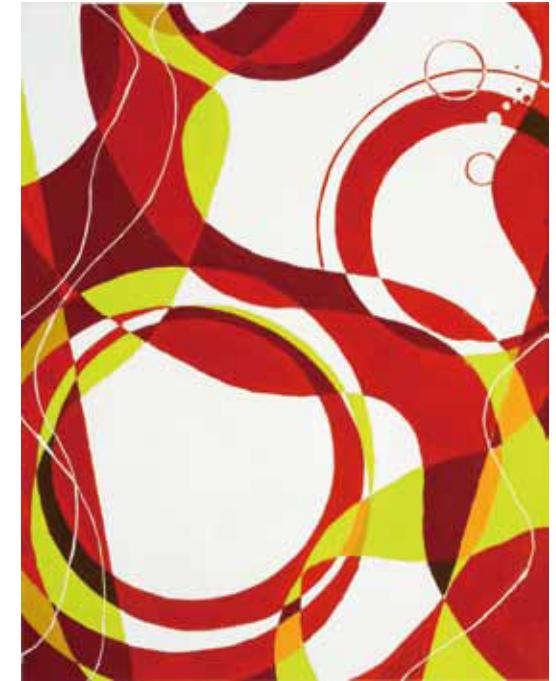
○尾道市立大学 美術学科 合格 大西佑佳(三崎 高校)