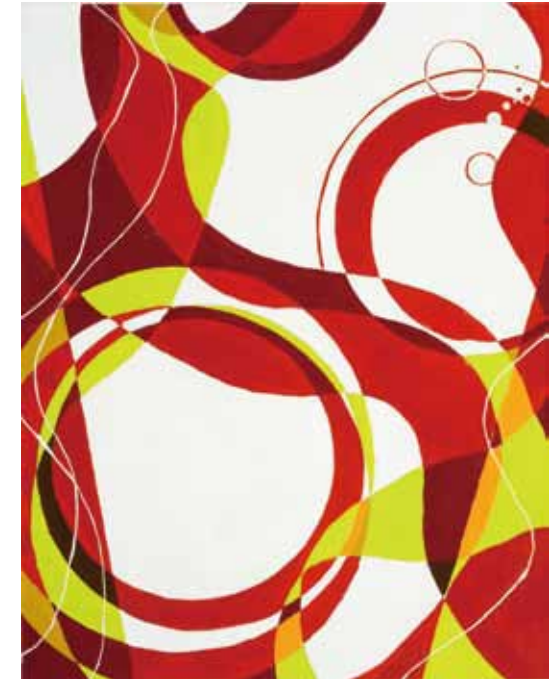
○尾道市立大学 美術学科 合格 大西佑佳(三崎 高校)